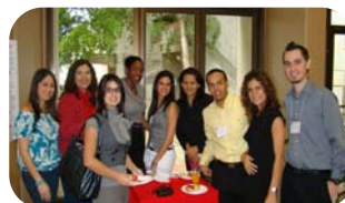
Algunos miembros del personal del CEA y la Oficina de Evaluación del Aprendizaje Estudiantil