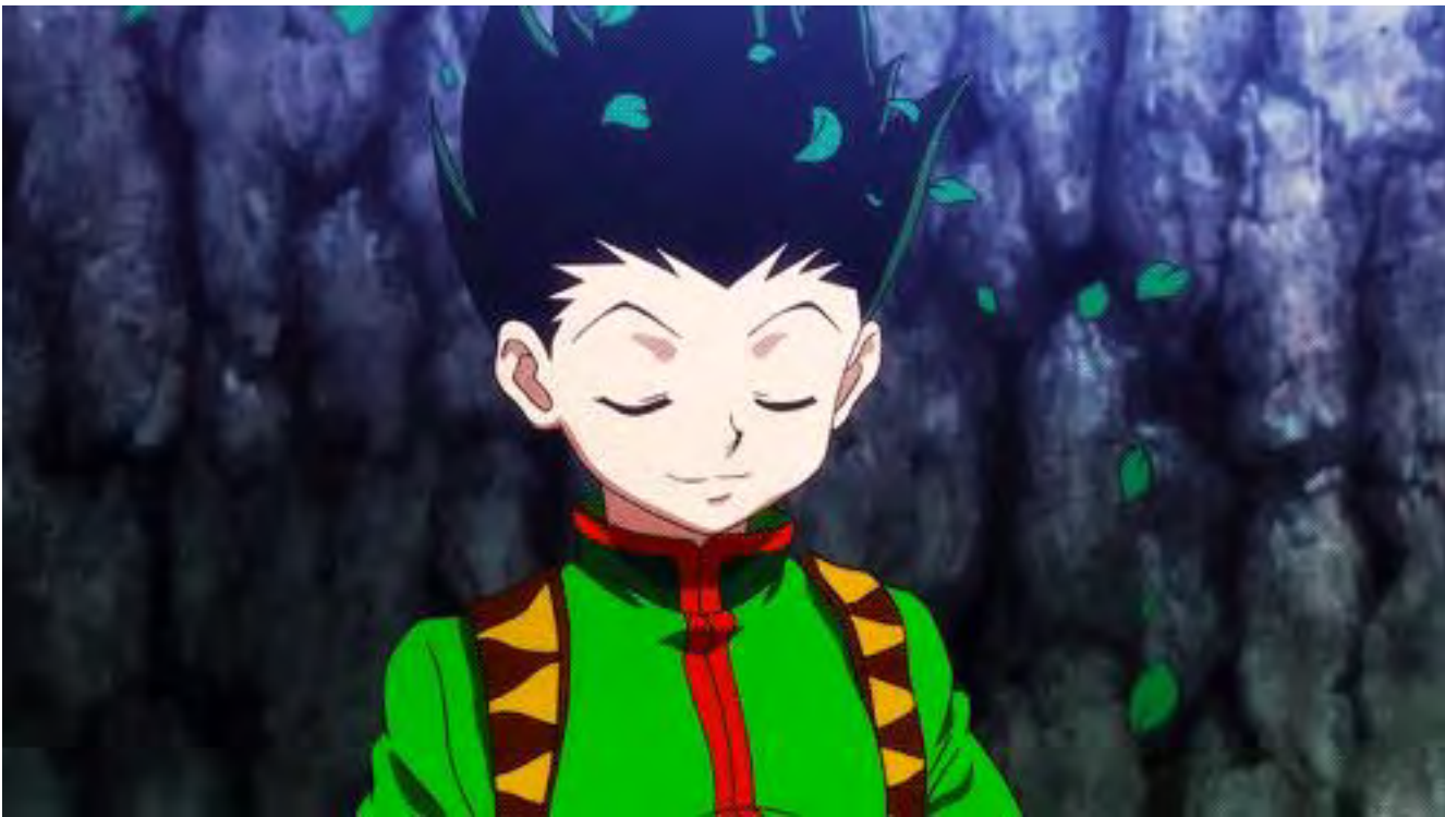
Imagen tomada de Otaku.com, 2016