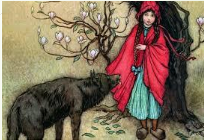
The tale of tales (1634) Giambattista Basile